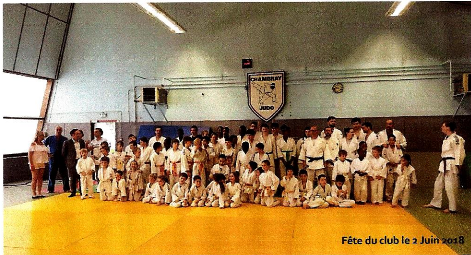
Fête du club le 2 Juin 2018

UNE PRATIQUE, UN ART DE VIVRE, UN CODE MORAL - METS DU JUDO DANS TA VIE !